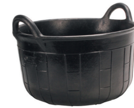
CARBONERA RUBBER BASKET N°2 (30 l) REF.88902