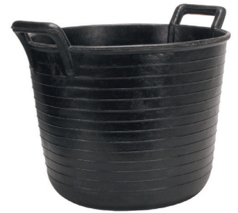
ESPUERTA RUBBER BASKET N°99 (33 l) REF.88804